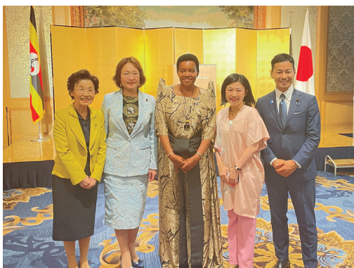
ウガンダ共和国独立61周年記念レセプション

地域ぐるみで健康増進に取り組むH&C 議連や東京2020オリパラ記念さくらリレーで訪れた三嶋大社に続き、今夏は鹿島神宮、熊野本宮大社、速玉大社、那智大社にて地域とのつながりを伺うことができました。心身の健康と同様に、社会の健康も