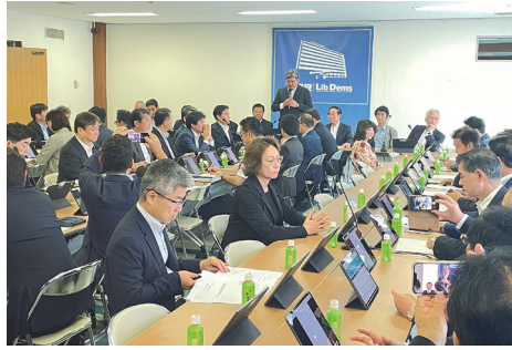
経済対策について議論(政調全体会議)