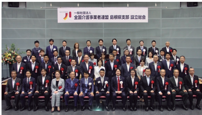
全国介護事業者連盟島根県支部設立総会

地域産業振興に直結する専門人材育成を進める趣旨から、国立大学で初めてとなる「材料エネルギー学部」が島根大学に開講しました。保健医療福祉分野ではかねてより、腰痛予防や転倒防止など職員の負担軽減と利用者のQOL向上に有用な機器類の開発・導入が期待されています。これからも幅広く科学技術の進展に関心をもち、効果的な医工連携と医療