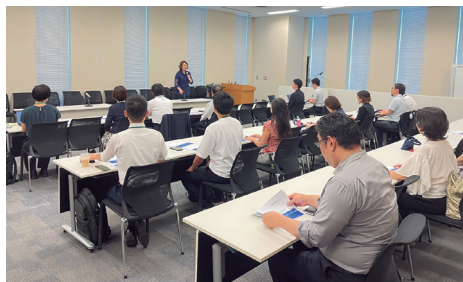
「女性の健康と社会問題」政策討論会

した国会議員等が続々戻り、地元で培ったアイデアを国政へ反映させようと、意気軒高に活動しております。自民党政務調査会では、9月下旬の総理指示を受け、経済対策に盛り込む内容を議論しています。まずは各部会が中心となって、①国民生活の安定確保、②地方の成長支援、③国内への投資促進、④変化への対応、⑤地域社会の安全・安心という五本柱を軸に検討し、政府一丸となって、臨時会での補正予算成立をめざします。