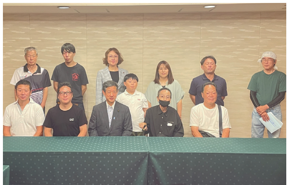
ふるさと対話集会(宮城県石巻市)

岸田総理は、認知症施策を総合的に推進するため「認知症と向き合う『幸福社会』実現会議」を設置しました。男女共に平均寿命が延び、高齢者世帯数は急増しています。人生100年を照準に考えれば、65歳からの人生をより豊かに暮らせる社会環境の醸成は、次代に向けた大きな政策テーマです。2014年当時の政務官検討会が省庁横断による政策群「幸福社会への挑戦、ハッピープラチナ運動」を提唱し、2015年度予算編成過程で各種