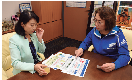
矢田首相補佐官と女性政策について協議