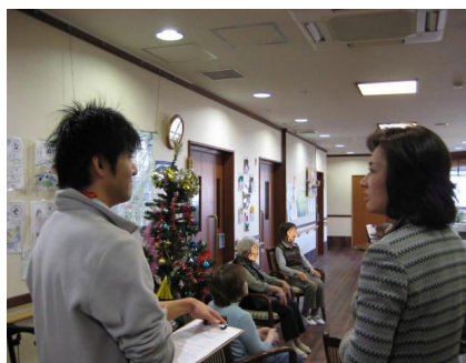
グループホーム（松戸）