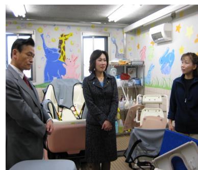
療養通所介護事業所（横浜）