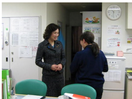
訪問看護ステーション（横浜）

住み慣れた地域の中で穏やかな最期を迎えたいと望んでいる方は多いにも関わらず、実際にはその要望に応えるにはまだまだ不十分な状況にあります。いかにして自分らしく生きる終えることができるか、これは誰もが否応なく考える人生の大命題です。「死」という問題には目をそむけがちですが、これは「命」の問題であり、穏やかな最期をいかに支えるかということは、すなわち、命の尊厳をいかに守るかということではないでしょうか。たかがいは、穏やかな最期を実現する仕組みづくりのため、しっかりと活動していきます。